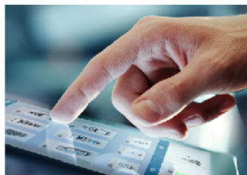
KIP多点触摸屏 KIP 70系列的所有系统功能均通过集成的12“多点触摸彩色显示器执行，可复印，打印和扫描彩色和黑白文档。