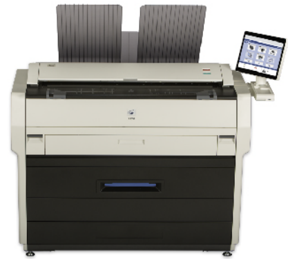
KIP 7170 多功能系统，集成了CIS扫描仪和顶部堆图打印托盘

KIP 7170多功能生产型系统以最高质量完成打印工作和缩短交货时间。操作员使用KIP系统 K打印管理套件中的专业应用程序享受优异的预览和打印提交作业。KIP 720 CIS扫描仪集成化机体设计，为彩色扫描速度，页面朝上/朝下/厚纸介质输送多样性和数字成像质量创造了全新的高标准。