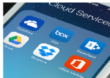
KIP云连接 通过流行的云服务共享在线内容已成为关键的协作工具。直接在多点触摸显示屏上云打印和扫描至云。