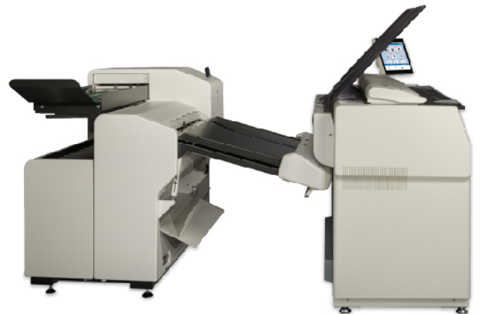
配置 KIP 7170 多功能生产型系统选配的KIPFold 2800在线全自动折图机