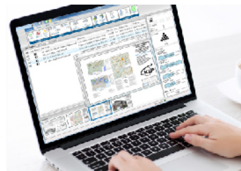
KIP打印提交 KIP PrintPro专为Windows®PC而设计，是一套直观的系统管理和打印提交应用程序，适用于全系列的系统。